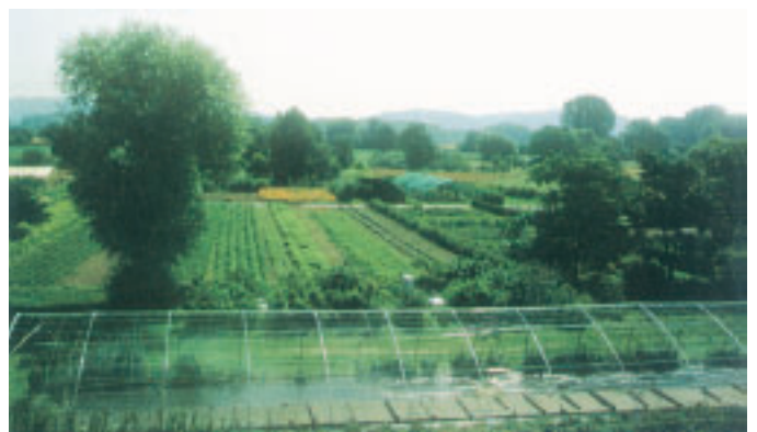
Arzneipflanzenkulturen der Deutschen Homöopathie-Union in Staffort bei Karlsruhe.

Sämtliche Ausgangsmaterialien werden vor der Verarbeitung auf Identität und Qualität geprüft. Zudem ist jeder Verarbeitungsschritt von einer umfassenden und strengen Kontrolle begleitet.